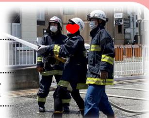
前回開催時の様子