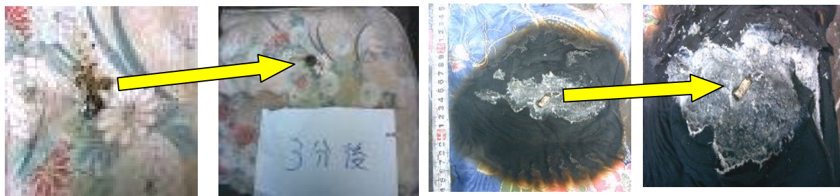
火種落下直後の状況 落下3分後の状況 落下30分後の状況 落下40分後の状況

焼損状況と関係者の聞き込み状況から、①家人が外出前にタバコを吸っていること。②焼損箇所にタバコ火災（無炎燃焼）特有の焼け込みが見られること。③他の火災原因と考えられるものが否定されることから、タバコの火により、無炎燃焼を継続し、家人が外出後、数分後に出火したものと推定しました。