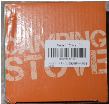
パッケージの状況

今回の事案は、インターネットショッピングサイトを通じて購入し屋内で試しに点火したところ、バーナーの炎に漏れ出したガスが引火し、これを消火するために両手に火傷を負っています。