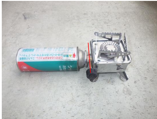
カセットボンベをセットした状況