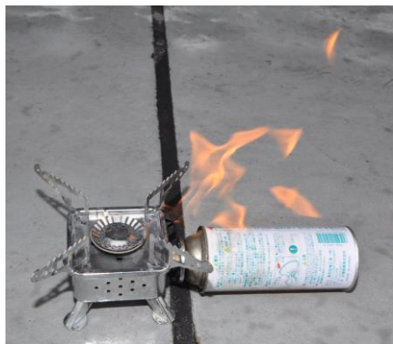
漏れ出したガスに引火した状況