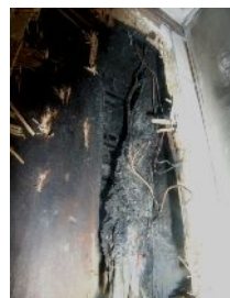
壁内部の電気配線の状況