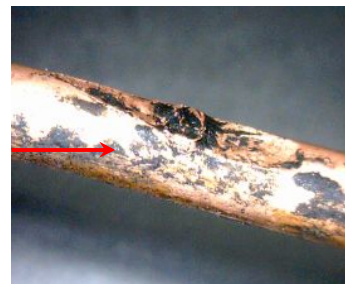
電気配線に小動物の噛み跡が見られた