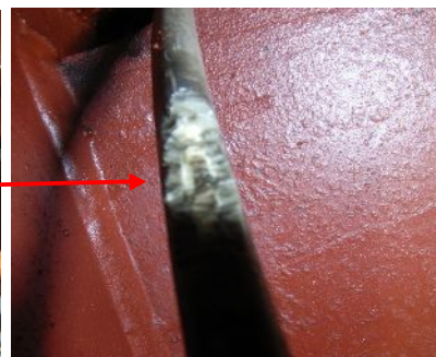
小動物の噛み跡の状況

出火箇所上の天井裏には小動物の糞が散乱しており、付近の電気配線の一部に噛み跡が見られる