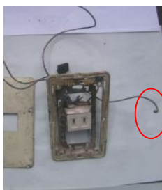
屋内配線に電気痕が見られた

これらの状況から、壁付きコンセントの内部の屋内配線の被覆を小動物（たぶん、 ねずみ ）に噛まれ屋内配線が損傷により発熱、短絡して出火したものと推定しました。