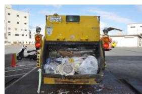
↓ 荷箱から外へ ↓

リチウムイオン電池は、 圧迫や衝撃を受けると内部の保護機構が破壊され、異常な電圧・電流が発生し、膨張し破裂して発火するという現象が起こるので、今回はそれによって火災になったものと推定されます。