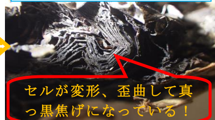
セルが変形、歪曲して真っ黒焦げになっている!

ゴミ袋の中に入れられた枯草の中から、焼けた「モバイルバッテリー」ができました!!