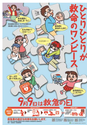
「救急の日」ポスター

本消防組合公式 YouTube チャンネル「hirane119」では、様々な救急行政の P R 動画を配信しています。