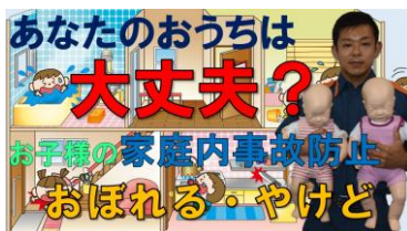
おぼれる・やけど 編