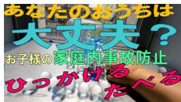
ひっかける・たべる 編