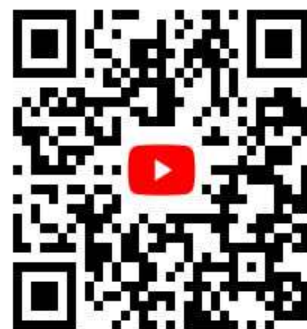
枚方寝屋川消防組合公式 YouTube チャンネル 「hirane119」

本消防組合では公式 SNS を活用して、適切な119番通報要領など119番通報の適正利用も呼びかけます。