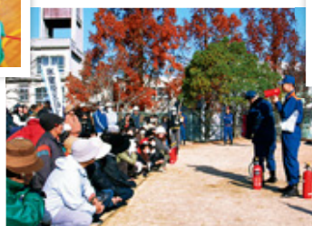
消火器による消火訓練