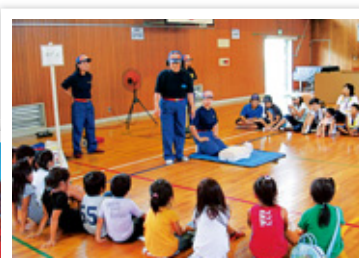
女性消防団員による救急法