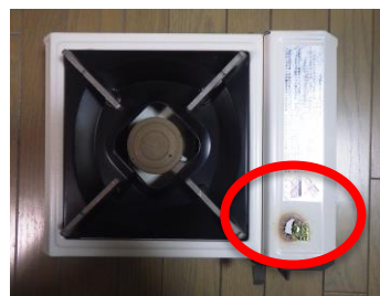
炎が出ていた部分

カバーを開けると、カセットコンロとカセットボンベの接続部付近から炎が出ていたものです。