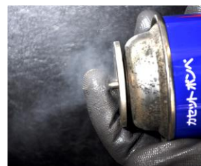
ノズル周辺の隙間から ガスが漏れ噴き出す